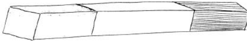
Fig. 9 – Esempio di bastoncino-test